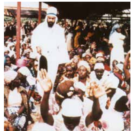
Maitreya como apareció en Nairobi en 1988.

ficación de Alemania del Este y Oeste después de la caída del muro de Berlín, la disolución de la Unión Soviética en estados independientes, el final de la Guerra Fría, y la elección de Nelson Mandela como presidente de Sudáfrica terminando así con la segregación racial de ese país. Desde entonces, la rampante corrupción mundial en gobiernos y negocios ha sido expuesta, y la creciente “voz del pueblo” continúa con la demanda por justicia económica y social para todos, como así también la restauración y protección ambiental. Éstas voces desafían la represión de regímenes en todas partes del mundo.